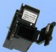
CU-FC6 automatický zberný kôš