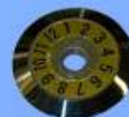
FCP-20BL otočný nôž